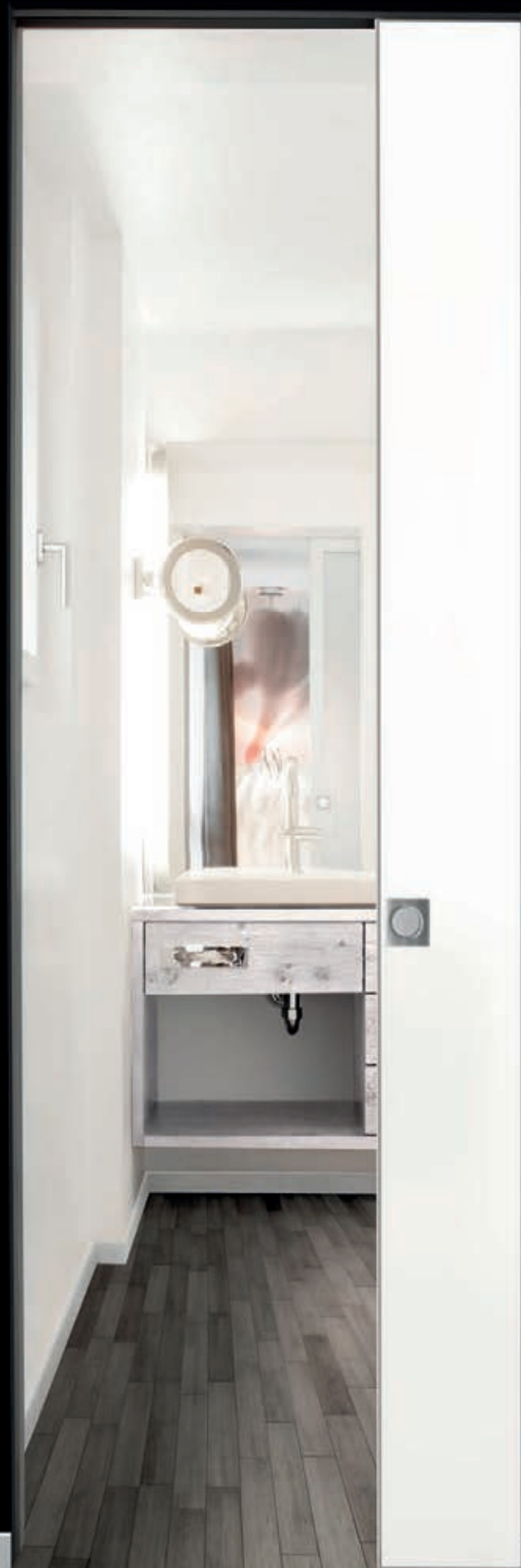
porta scorrevole a scomparsa sliding door with pocket system porte coulissante escamotable представлены скрытые раздвижные двери jednokrılna klizna vrata